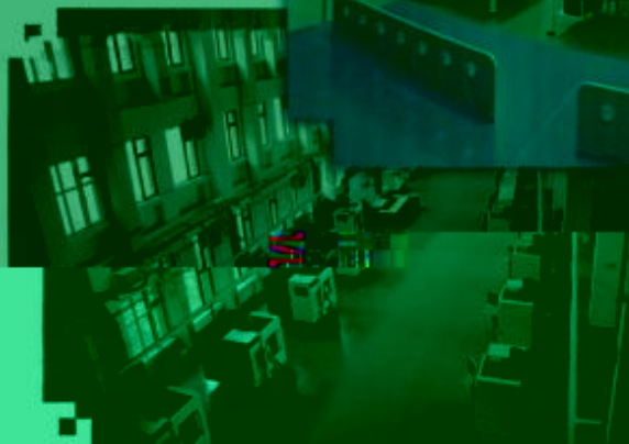
DMG 数控技术 训练场所